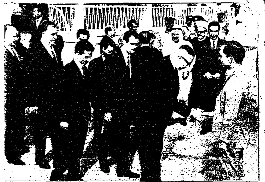
المؤراء وكبار الموظفين يصافحون جلالة الملك العظيم مؤدعين